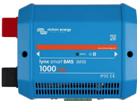
Lynx Smart BMS NG 1000 A