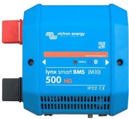
Lynx Smart BMS NG 500 A