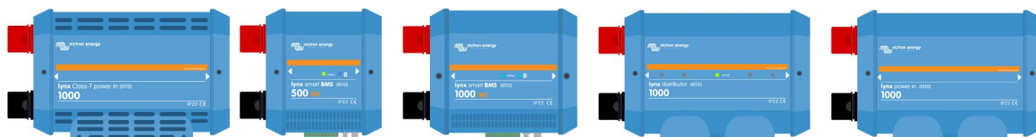
Lynx Distribution-Produkte mit M10-Sammelschienen